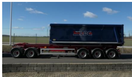
Flaket läge vid tippning. Längst bak utan tippskägg. Snabbt och stabilt