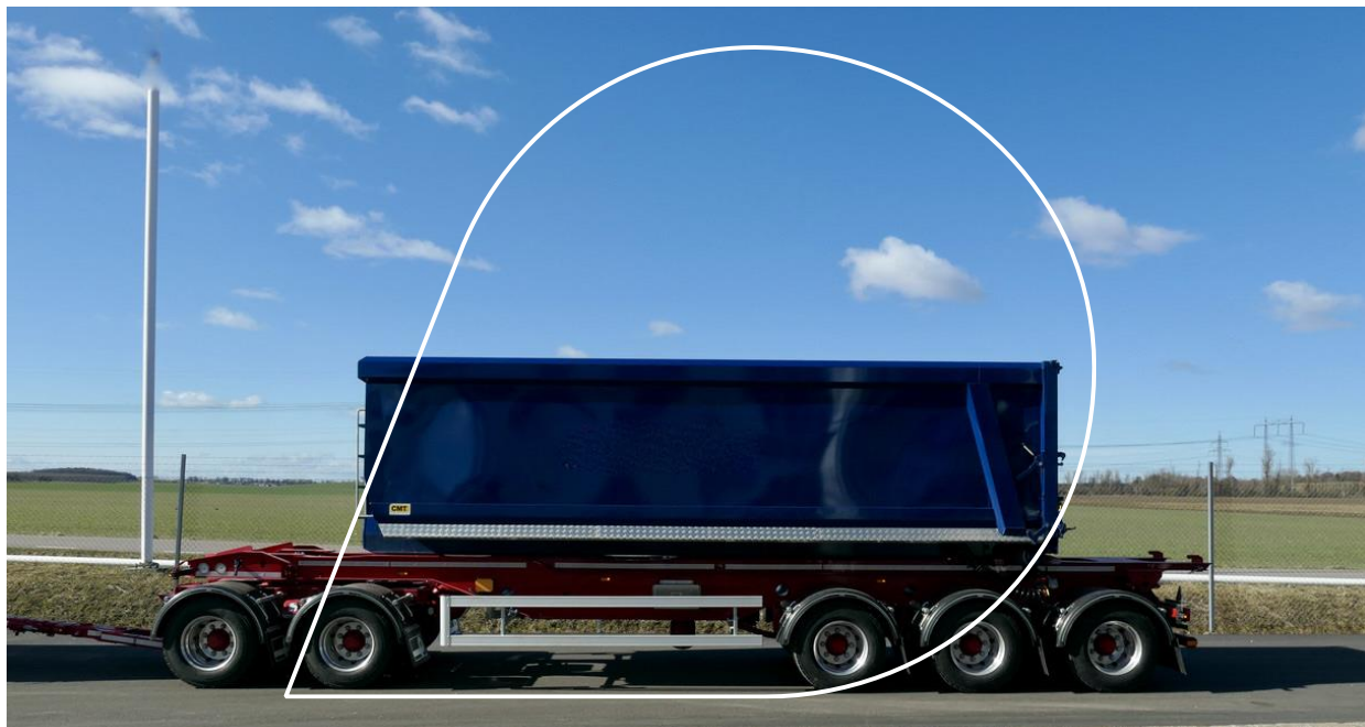
Modellen finns också i 4-axlat utförande, III LT18-20, egenvikt 7200 kg

Parator presenterar LT18-24, en tippvagn för lastväxlare med 42 tons totalvikt. Först i sitt slag. Vagnen lastar 36 ton inklusive flak, tack vare sin låga egenvikt på knappt 8 ton.