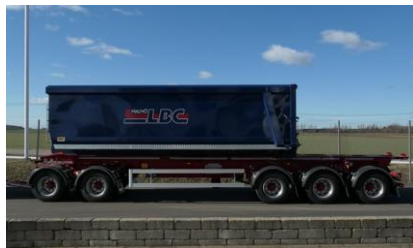
Flaket läge vid rangering. Inget behov för lång sticka på lastväxlaren